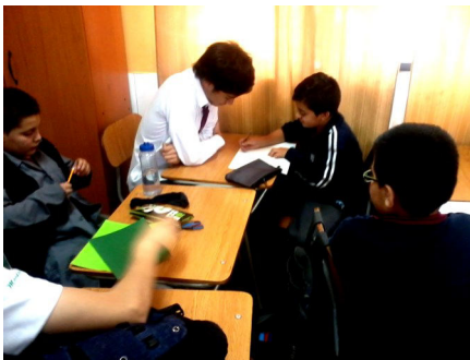
Estudiantes del 3° medio matemático IOH.

En el año 2014 los alumnos del 3° Matemático del Instituto O'Higgins, trabajaron una experiencia de Aprendizaje y Servicio con un quinto básico de la Escuela Municipal Isabel Riquelme. Este año 2015, como Cuarto Año Medio, también con la asignatura de Filosofía los estudiantes junto a su profesor decidieron realizar un nuevo proyecto, en donde trabajarán la temática de la "autonomía y responsabilidad".