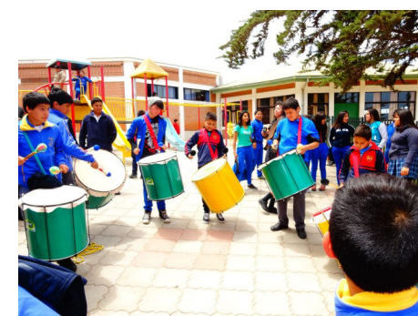
Jóvenes ensayando previo a salir a la comunidad