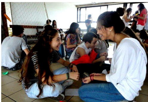
Imágenes de estudiantes Colegio Juan Zorrilla de San Martín, Uruguay.