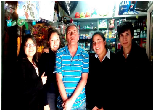
Jóvenes junto a apoderado dueño de negocio.

El proyecto realizado el año 2014 por el profesor Erick Silva de la enseñanza técnico profesional del Colegio Marcelino Champagnat, consistió en realizar una asesoría administrativa a los pequeños negocios de la población en donde se encuentra inserto el establecimiento. Los estudiantes de la especialidad de administración analizaron los procesos productivos de compra y ventas, para así entregarles a los dueños de negocios una propuesta de trabajo que optimizara los recursos, haciendo más eficiente la labor económica y de producción.